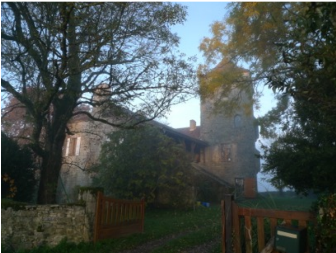
la bastide Foyras

Il ouvre donc à un état propice à l'expérimentation scénique.