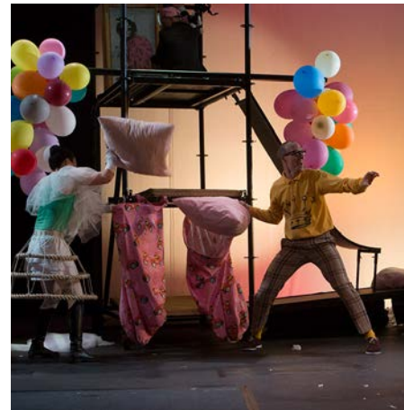
Qui rira verra de Nathalie Papin