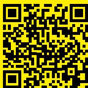
ILLUSTRATION ARNAUD NEUBERT

COMMUNICATION & DIFFUSION MARION PODAVINI