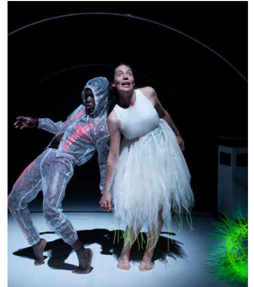
Quand j'aurai mille et un ans de Nathalie Papin