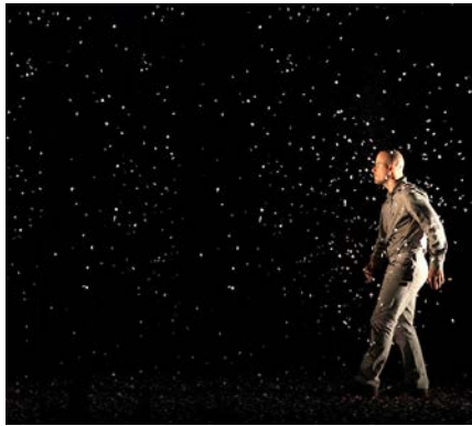
Ailleurs et maintenant de Toshiki Okada