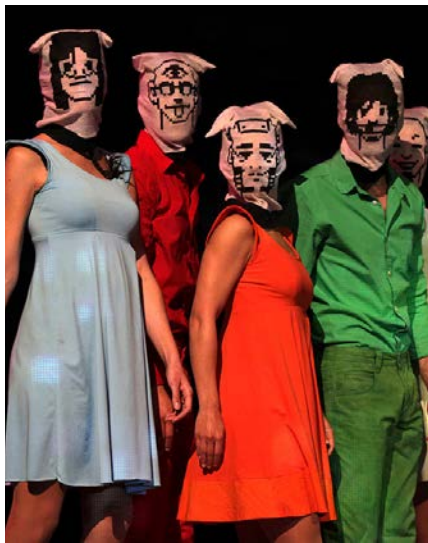
Cinq jours en mars de Toshiki Okada